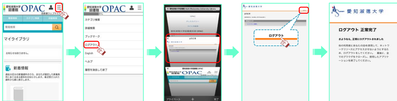
① 図書館ウェブサイトからログアウト

! 利用が終わったら、必ずログアウトをしましょう。しばらくの間、再ログインができなくなることがあります。